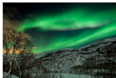
ノルウェーで見えるオーロラ

大気の粒子がもらったエネルギーを放出してもとに戻ろうとする時に起こる発光現象がオーロラです。プラズマを下向きに加速する領域は緯度の高い場所にもみ存在するために、北半球か南半球の高緯度地方でしかオーロラは見られません。