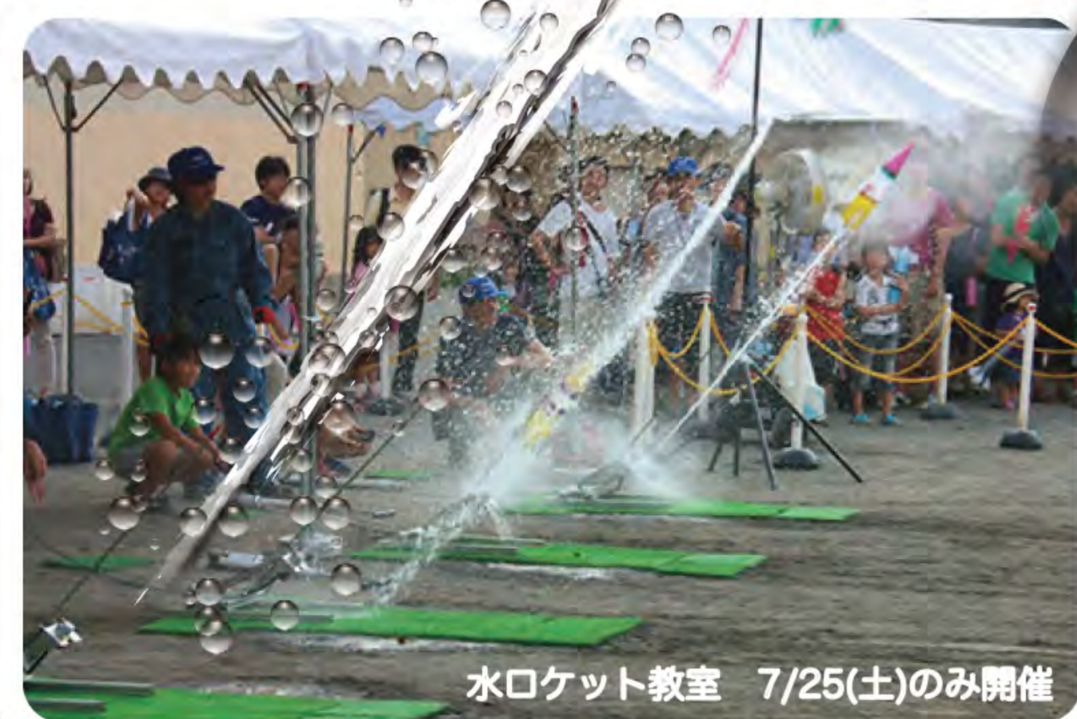
水ロケット教室 7/25(土)のみ開催