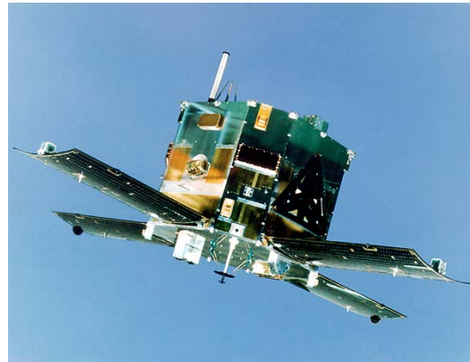
えいせい あけぼの衛星の写真

1989年2月22日に打ち上げられた「あけぼの」衛星は、2009年に満20歳の誕生日を迎えました。現役で観測を続けている科学衛星としてはとても長生きな衛星です。今日も地球周辺の荷電粒子や電磁波に関する貴重な観測データを送っています。「あけぼの」は宇宙からのオーロラ観測によって、オーロラの発生する仕組みを調べることを目的として打ち上げられました。20年以上にわたる長期間の観測のおかげで太陽活動の11年周期変動が地球の磁気圏にどのような影響をおよぼすのか、明らかになってきました。2011年になると22年の太陽活動周期の影響についても調べることができるようになるでしょう。ちなみに、1992年7月24日に打ち上げられた「ジオテイル」衛星も2010年に18歳を迎える、「あけぼの」に次ぐ現役で活躍する長生き衛星です。