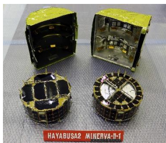
小惑星探査ロボット